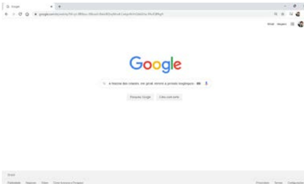
FIGURA 1 – UTILIZANDO O SITE GOOGLE